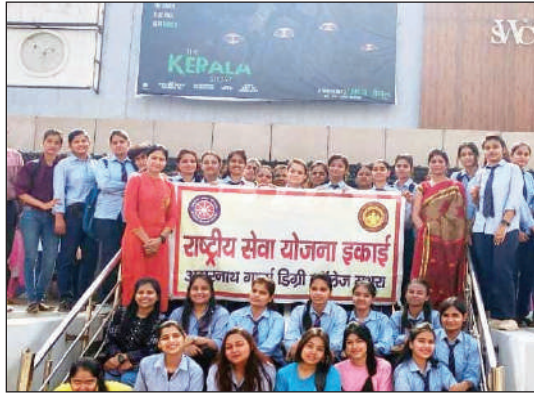
फिल्म में दिखाया गया है वह लड़कियों के साथ गलत करते हैं लड़कियां भावुक होती हैं

टीम एक्शन इंडिया/मथुरा/लोकेश चौधरी। राष्ट्रीय सेवा योजना इकाई की 112 छात्राओं ने सिनेमा हाल में आयोजित विशेष शो में 'द केरला स्टोरी' फिल्म देखी, फिल्म देख कर छात्राएं भावुक हो गईं। 'द केरला स्टोरी' फिल्म देखकर छात्राएं सिनेमा हॉल से निकलने के बाद भावुक दिखाई दीं और छात्राओं की आंखों में आंसू थे, वहीं छात्राओं का कहना है कि यह फिल्म सच्ची घटना पर आधारित है, जो कुछ भी